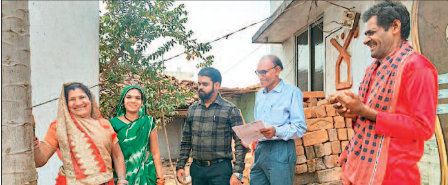
ये दस्तावेज जरूरी

यह लोग होंगे आबादी आवास के लिए पात्र निगम के मुताबिक हितग्राही आबादी भूमि में 31 अगस्त 2024 के पूर्व नगर पालिक निगम भिलाई क्षेत्र में निवासरत हों। हितग्राही के परिवार जैसे- पति, पत्नी एवं आश्रित बच्चे के सक्स्ट स्ट्रॉट से वार्षिक आय अधिकतम राशि 3.00 लाख रुपये से अधिक नहीं होना चाहिए। पिछले 20 वर्षों में केन्द्र सरकार, राज्य शासन एवं नगरीय विकास के किसी भी आवास योजना का लाभ न लिया हो।