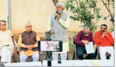
श्रीराम जन्मोत्सव समिति की बैठक में दी गई तैयारियों की जानकारी

श्रीराम जन्मोत्सव समिति की बैठक सेक्टर-9 में हुई। इसमें 26 मार्च को आयोजित श्रीरामनवमी उत्सव और शोभायात्रा की तैयारियों पर चर्चा की गई। बैठक में समिति के संरक्षक और प्रदेश के पूर्व विधानसभा अध्यक्ष प्रेमप्रकाश पाण्डेय मुख्य रूप से उपस्थित थे। उन्होंने समिति द्वारा वर्षों से किए जा रहे कार्यों की सराहना करते हुए आयोजन की महत्ता पर प्रकाश डाला और एक मुट्ठी दान-श्रीराम के नाम अभियान की जानकारी दी। प्रेम प्रकाश पाण्डेय ने कहा कि पिछले चार दशकों से समिति द्वारा निरंतर आयोजित यह पर्व हमारी सांस्कृतिक धरोहर और आस्था का प्रतीक है। श्रीरामनवमी का पर्व धार्मिक आस्था के साथ-साथ सामाजिक और सांस्कृतिक एकता का भी प्रतीक है। युवा विंग अध्यक्ष और भाजयुमो प्रदेश कार्यसमिति सदस्य मनोष पाण्डेय ने कहा कि भगवान श्रीराम का जीवन मर्यादा और आदर्शों की मिसाल है। इस वर्ष का आयोजन विशेष रूप से धार्मिक-सांस्कृतिक कार्यक्रमों और भक्ति संध्या से सुसज्जित होगा। उन्होंने बताया कि शहर के प्रमुख मार्गों से भव्य शोभायात्रा निकाली जाएगी और एक मुट्ठी दान-श्रीराम के नाम अभियान के माध्यम से अन्न संग्रह कर महाप्रसाद तैयार किया जाएगा। शोभायात्रा के दौरान पुष्पवर्षा, झांकियों, रामायण पाठ, भजन संध्या और धार्मिक प्रवचन का आयोजन होगा। इसके साथ ही श्रीराम