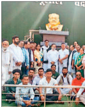
हरिभूमि न्यूज ►► गिलाई